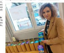
Des protections hygiéniques vont être mises à disposition dans les sept permanences de la MLBH du territoire.